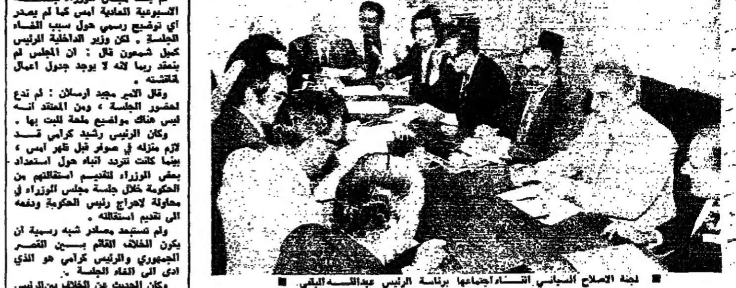
لجنة اصلاح السياسي اتساع اجسامها برئاسة الرئيس عبدالقادر البكري

لم يفتد مجلس الوزراء جلسة اليوم لاجتماعه العادي امس كما لم يصدر اي توجيه رسمي حول سبب ابقاء الجلسة. لكن وزير الداخلية الرئيس كميل شمعون قال: ان المجلس لم يفتد ربما لانه لا يوجد جدول اعمال لاجتماعه. وقال وزير موجه ارسال: لم ندع لعضو القصر، ومن المعتقد انه ليس هناك مواضيع ملحة لبحثها. وكان الرئيس رشيد كرامي قد اتم منزله في صوفيل قبل ظهر امس، بينما كانت تتردد اخبار حول استعداد بعض الوزراء لتقديم استقالتهم من الحكومة خلال جلسة مجلس الوزراء في محاولة لاجراء رئيس الحكومة ونفذه التي تقدم استقالته. ولم تستعد مصادر شبه رسمية ان يكون الخلاف القائم بين القصر الجمهوري والرئيس كرامي هو الذي ادى الى ابقاء الجلسة. وكان الحديث عن الخلاف بين الرئيس كرامي والقصر يدور بشكل «مسي» وراء كراي كرامي صيدا وداخل التحالف الكلاسيكي وبعض القوميين من الرئيس كرامي. ولجيت بعض الروايات قبل انعقاد جلسة مجلس الوزراء التي قد التزم بان الخلاف بين الرئيس والحكومة والقصر وصل الى حد الخطورة، وان الهامتي التي يفتد كسر الجليد بينهما قد مات بفشل.